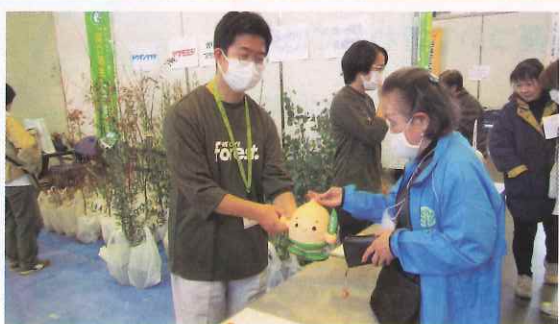
緑化苗木の配布 (敦賀市)