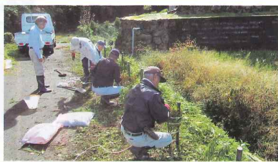
地域での植樹活動 (南越前町)