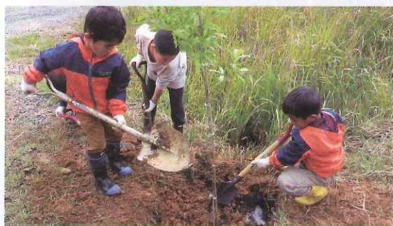
子ども達の森林学習 (若狭町)