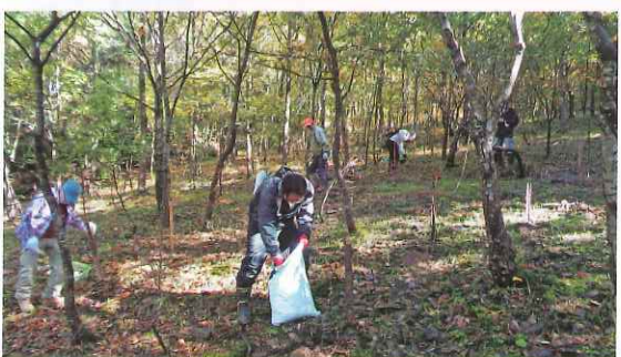
ボランティアによる森づくり活動 (永平寺町)