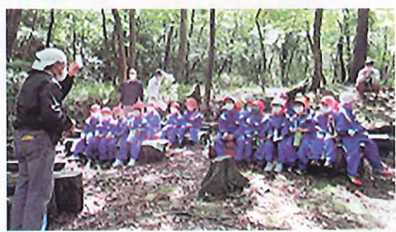
子どもたちの森林学習(若狭町)