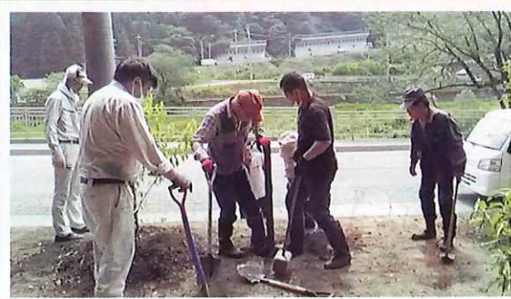
ボランティアによる森づくり活動(大野市)