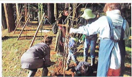
地域での植樹活動(越前市)