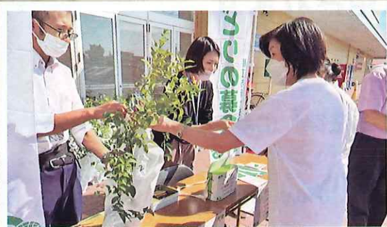
緑化苗木の配布(鯖江市)