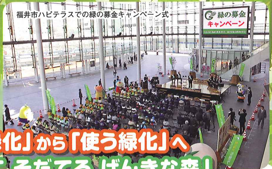
福井市ハピテラスでの緑の募金キャンペーン式