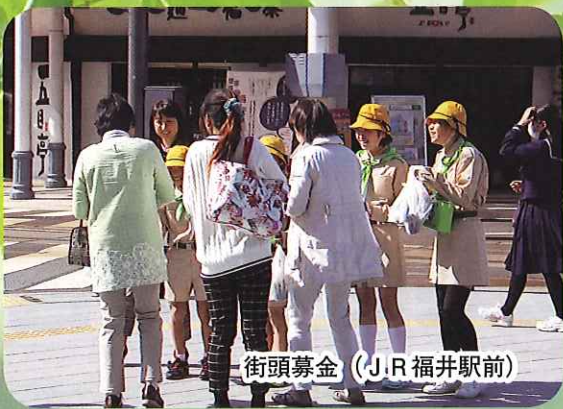
街頭募金 (JR福井駅前)