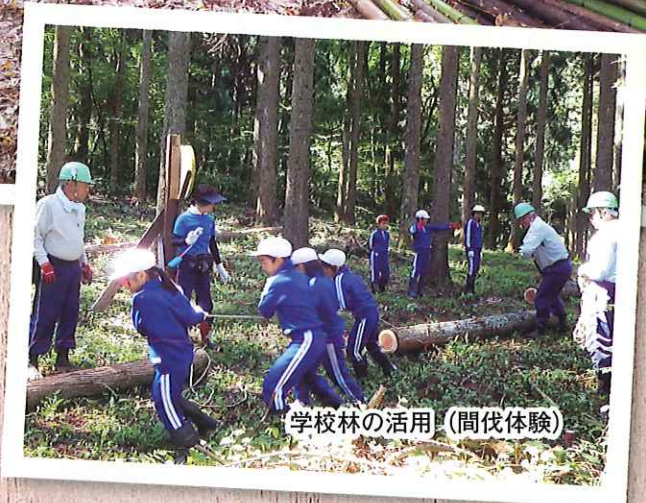
学校林の活用(間伐体験)