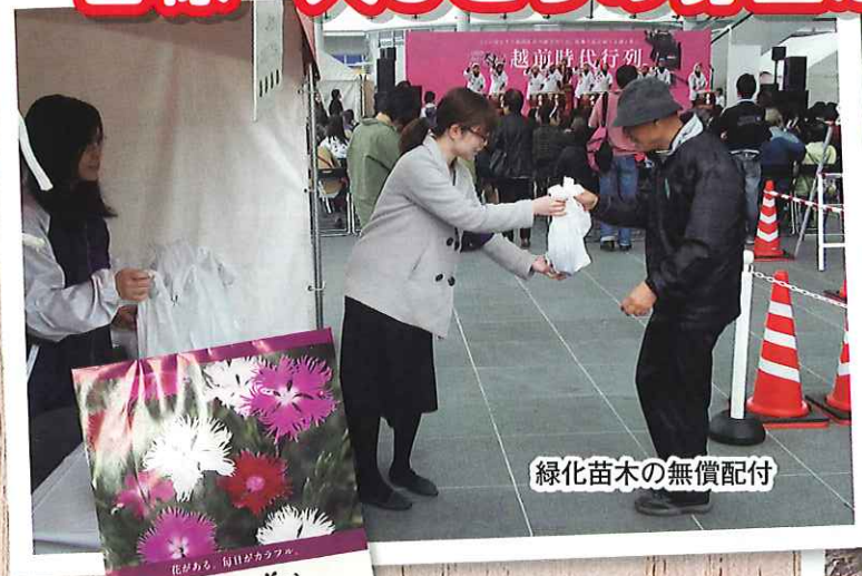
緑化苗木の無償配付